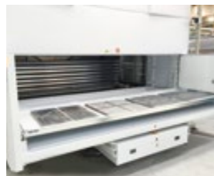
ENKEL EXTERN WERKSTATION