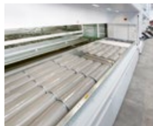
ENKEL INTERN WERKSTATION

Het interne werkstation is ideaal wanneer ruimte van het grootste belang is. Het externe werkstation zorgt voor hogere productiviteit en betere ergonomie door een snellere picking. De enkele aflegpositie is ideaal bij matig gebruik van de machine of wanneer de picksnelheid reeds voldoende is. Met een dubbele aflegpositie wordt de picksnelheid geoptimaliseerd.