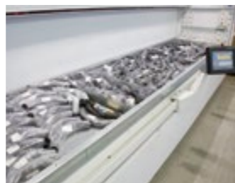
DUBBEL INTERN WERKSTATION