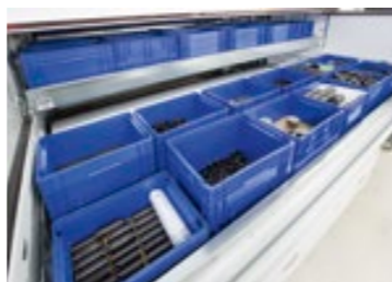
DUBBEL EXTERN WERKSTATION